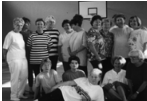
Einmal pro Woche gehts ins Turnen.

Auf 26. September 2003 werden wir zur Jubiläumsfeier in den Gemeindesaal einladen.