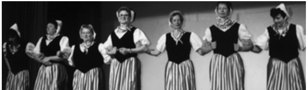
Alle zwei Jahre wird fleissig fürs Chränzli geübt.

Und als Belohnung für alle Mühe gehen wir jedes Jahr auf die Turnfahrt und haben viel Spass.