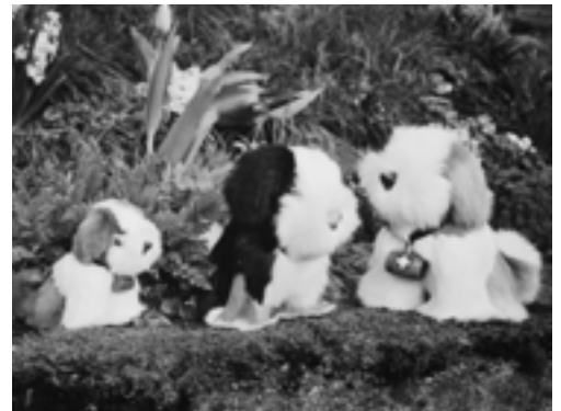
Die lustigen Bernhardiner sind in der Fellnähgruppe entstanden.

Wir freuen uns auf Ihren Besuch am 31. August 2003 in Bonstetten