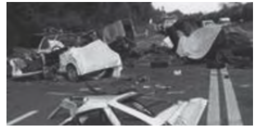
Bild der Zerstörung auf der Forchstrasse

versagen davon ab, erste Hilfe zu leisten. Dabei sind es bei einem Notfall oftmals die ersten Minuten, die über den Verlauf entscheiden.