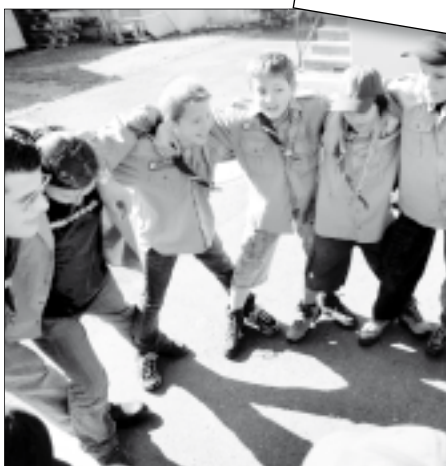
Traditionelles Antreten in der Pfadistufe am Pfingstamstag.