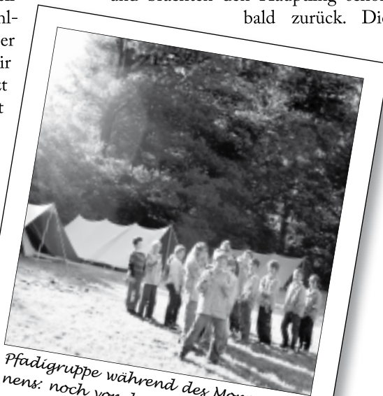
Pfadigruppe während des Morgenturnens: noch vor dem Frühstück.

Die Ureinwohner überfielen uns erneut und konnten fast alle von uns gefangen nehmen, leider auch mich. Wir Gefangenen standen dichtgedrängt im Kreis und wurden gefesselt und zusammengebunden. Die Ureinwohner schlugen den letzten freien Pfadis ein Geschäft vor. Die Gefangenen werden freigelassen, wenn die Ureinwohner ihren Häuptling zurückbekommen. Dieser wird gerade von den Wilderern gefangen gehalten. Unsere Pfadikollegen erfüllten ihre Aufgabe gut und brachten den Häuptling schon bald zurück. Die