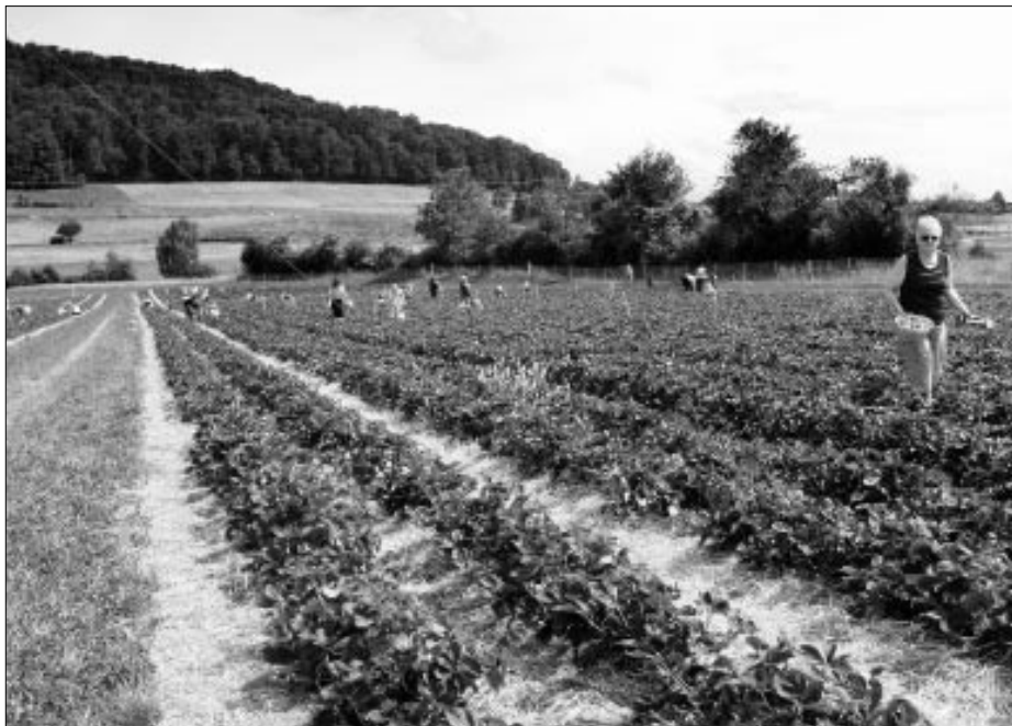
An schönen Tagen kommen bis zu 200 Erdbeerliebhaber, um hier Beute zu machen.

Erdbeermonat Juni. Familie Glättli aus Bonstetten öffnet ihr Erdbeerfeld. Manchmal parken auf der Wiese vor dem Erdbeerfeld vierzig Autos. Leute steigen aus, bewaffnet mit Schüsseln, Kistchen und Schachteln. Unterm Zelt-dach sitzt Frau Glättli, wiegt die leeren Behälter und schickt die Leute hinaus zu den Erdbeeren.