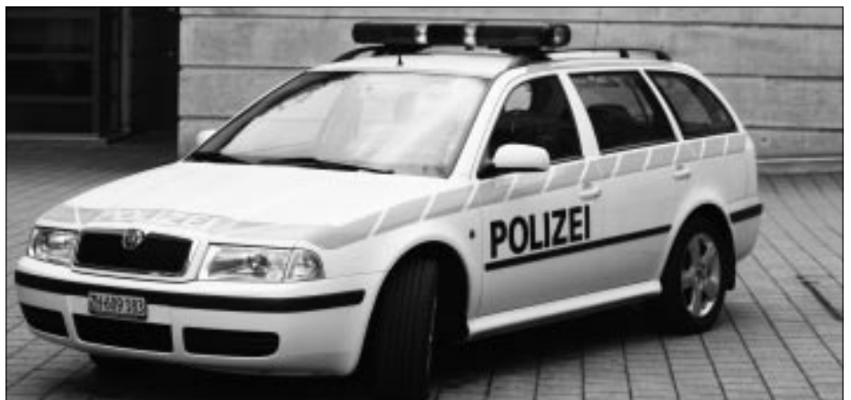
Kehtwende: auch für Polizisten fallen die Grenzen.