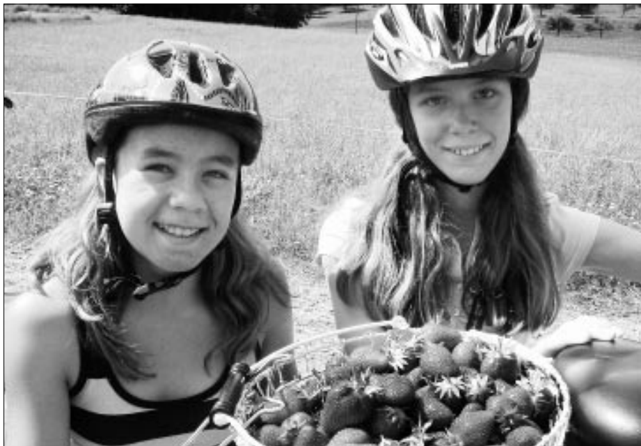
Ob jung oder alt: für die feinen Erdbeeren lohnt sich die Arbeit auf dem Feld.

Im Mai wird maschinell Stroh verteilt und mit der Heugabel unter jede einzelne Pflanze gelegt. Das Stroh ist wichtig, damit die Beeren sauber sind und weniger faulen. Die pflückenden Leute müssen stets einen Eimer mitnehmen für den Abfall, also für die faulen Beeren oder die