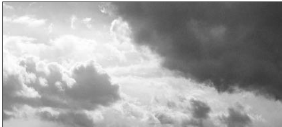
Dunkle Wolken ballen sich zusammen: bald kracht und schüttet es.