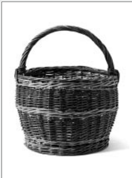
Geflochtener Korb

Im geregelten Rhythmus wurde mit dem Pflögel auf die Getreideähren gedrescht, damit sich die Frucht von der Schale löste. Anschliessend trennte der Röndler die Frucht und Schalen.