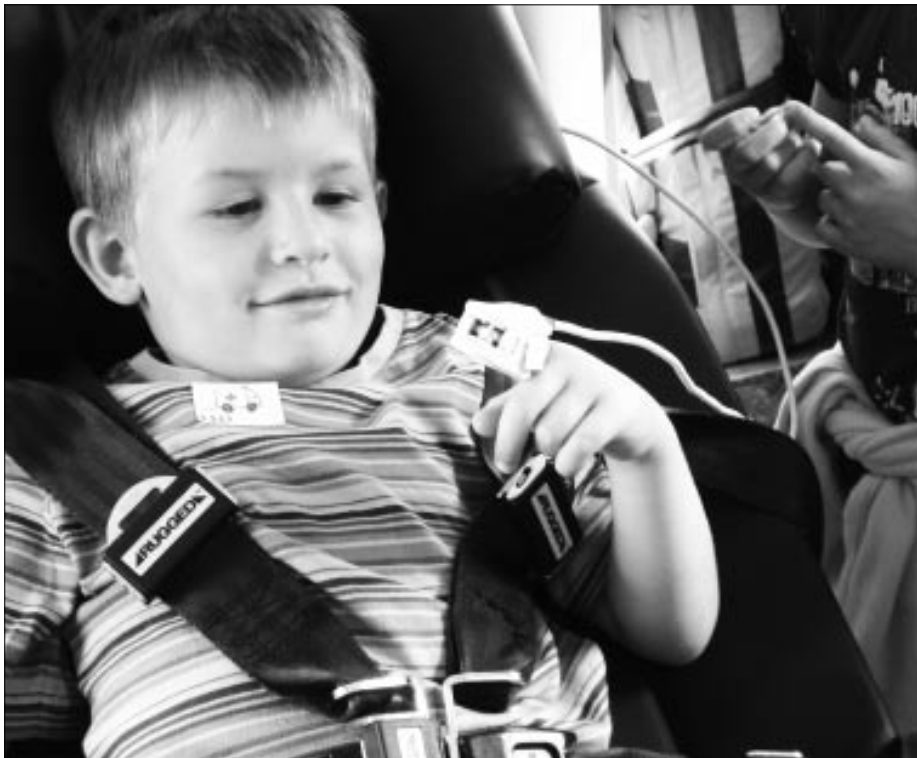
Spielerisch konnten die Kinder erleben, was mit den Patienten in einem Krankenauto passiert. (Bild: zVg)

«Sind die weissen Blutkörperchen ganz böse?» Diese und andere neugierige Kinderfragen wurden auf unserem spannenden Spitalausflug kindergerecht beantwortet. Alle wissen nun, dass die roten Blutkörperchen winzige Lastwagen sind, die den Sauerstoff an alle Orte im Körper bringen. Die weissen Blutkörperchen sind nicht böse, sondern eigentlich ganz lieb. Sie sind die Polizisten, die sofort die Bakterien verhaften, die nicht in unseren Körper gehören.