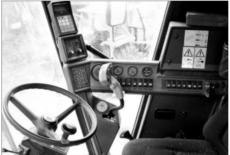
Blick ins Cockpit eines Mähdreschers.

Die einfachste Form von Dreschen kann jeder selber machen: Man zerreibt eine Ähre in der Hand, bis die Körner frei sind, dann pustet man die Strohresten fort, bis nur noch die reinen Körner übrig bleiben. Im Mähdrescher dreht die