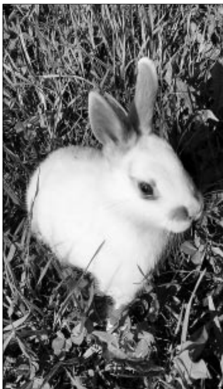
Eines der drei Findelkaninchen.

wäre? Die weisse Maus irrte in der Wiese umher und wurde schliesslich Opfer einer Katze. Der Hamster im Kornfeld legte sich erst einmal einen Vorrat an. Er entkam knapp einem Mäusebussard, wurde aber leider von einem Mähdrescher überfahren. Die Schildkröte und der Goldfisch hätten bessere Überlebenschancen. Der Goldfisch könnte sich vom Laich und den kleinen Kaulquappen unserer Amphibien ernähren, würde diese aber dadurch dezimieren. Die Schildkröte könnte sich eigentlich auch erhalten – zumindest bis der Weiher im Winter gefriert.