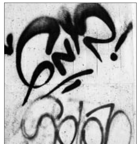
Schmierereien verunstalten Gebäude.

waltungen) in Bern ergab, sind nun pflegeleichte Toi-Toi-Kabinen hingestellt worden. Zusätzlich hat der Gemeinderat beim Bezirksrat ein audienzrichterliches Verbot beantragt, das den Aufenthalt auf dem Platz von 24 Uhr bis 7 Uhr verbietet. Und last but not least wird zurzeit zusammen mit der Stadt Affoltern a. A. ein umfassendes Überwachungskonzept ausgearbeitet, das auch eine Evaluation entsprechender Videokameratypen vorsieht. Zurzeit ist der Gemeinderat noch gegen eine Einzäunung.