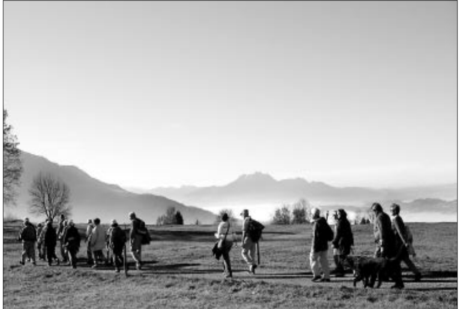
Die hehre Weite der Landschaft vor Augen: die Lust am Wandern ist grenzenlos. (Bilder: Ernst Baumann)

Hell und strahlend schien die Sonne auf der Wanderung von Pfungen aus. Es ging flussabwärts, dem leise gurgelnden Wasser entlang, an bunten Blumenwiesen vorbei, begleitet vom Zwitschern der Vögel. Um die Mittagszeit erreichten wir die Tössegg. Die einen setzten sich ins Gartenrestaurant, andere bevorzugten das Picknicken am Flussufer, dort wo die Töss sich mit dem majestätisch dahinfließenden Rhein vereinigt, wo gelbe Iris blühen und Wasservögel sich tummeln.