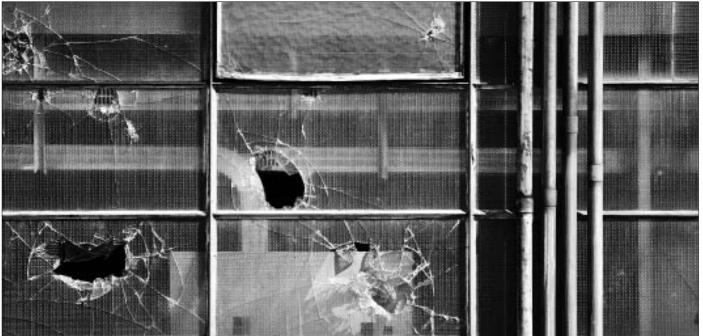
Die Anzahl der Vandalenakte im Raum Bonstetten nimmt leider weiter zu.

Der zunehmende Vandalismus, mutwillige Sachbeschädigungen und widerliche Schmierereien auch im Bereich des Spiel- und Begegnungsplatzes haben den Gemeinderat veranlasst zu handeln. Bauliche Massnahmen wurden beschlossen und sind teilweise bereits umgesetzt, ein umfassendes Überwachungskonzept wird ausgearbeitet.