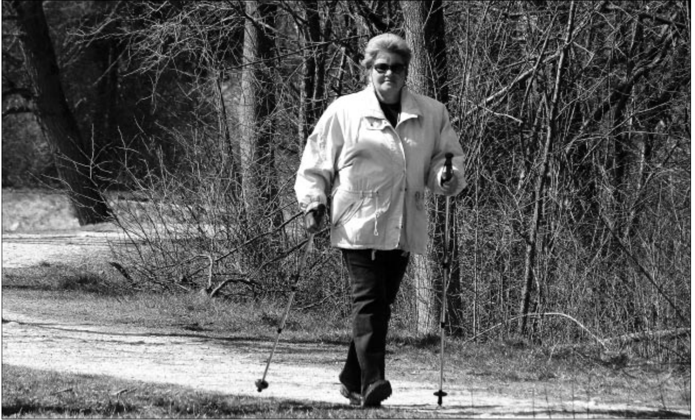
Nordic Walking kann in einem Pro-Senectute-Kurs in Bonstetten erlernt werden.

Am Freitag, 24. Juli 2009 startet Pro Senectute Kanton Zürich einen Nordic-Walking-Kurs in Bonstetten.