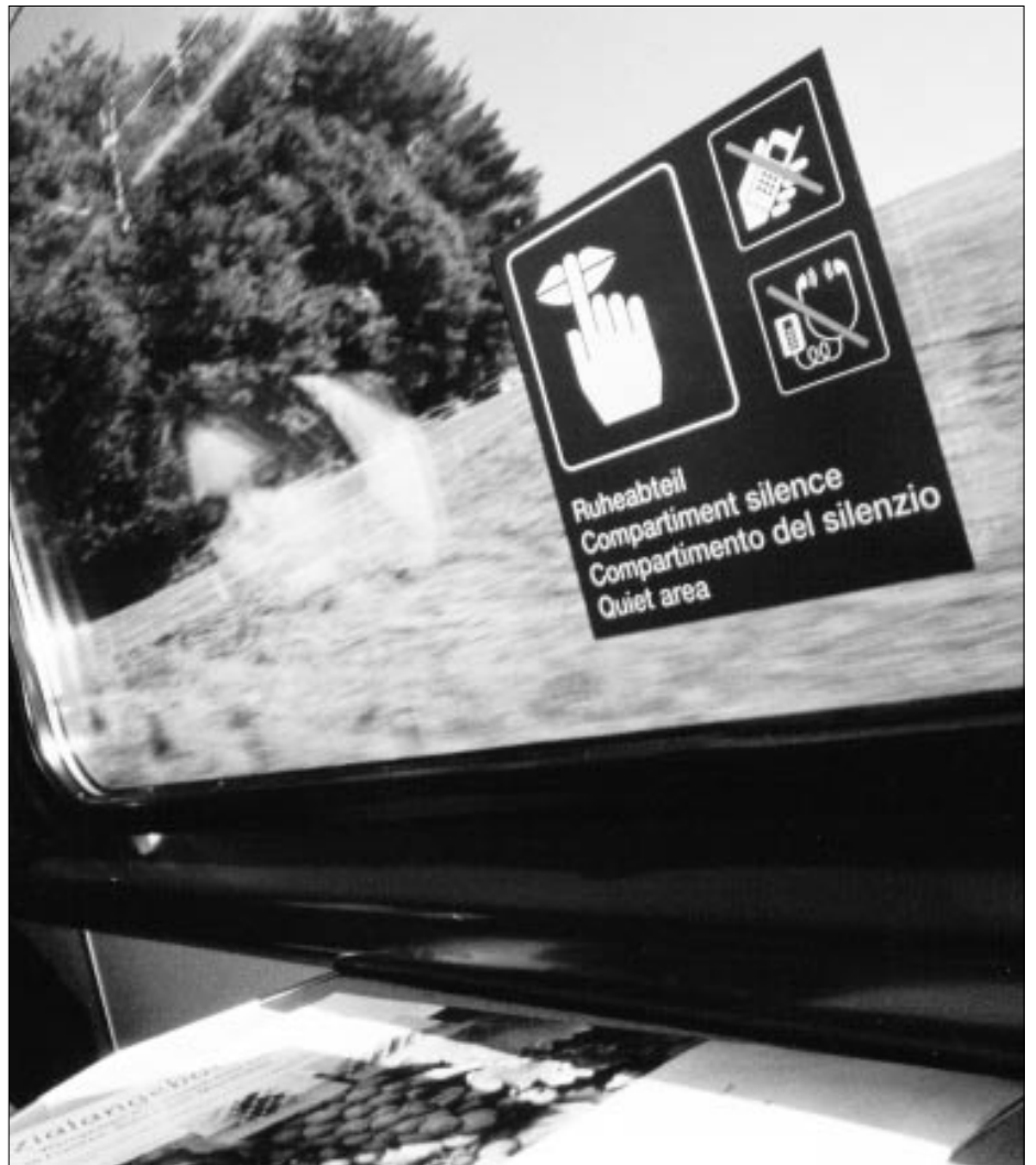
Wenn zwei den Boléro mit der Türe spielen: Ruhe futsch.

Durch die Glastüre – ich sitze diesmal gleich beim Eingang bzw. Ausgang – erkenne ich einen ungepflegten, turnschuhbewehrten, mantelbestückten, unrasierten, fellsträhnigen, sehr grossen Mann, der immer die gleiche Melodie vor sich hinpfeift, immer dieselben langweiligen Takte, in einem rudimentären Ostinato-Rhythmus, aber ohne Variationen, rauf und runter die Tonleiter – ohne Entwicklung. Er steht dabei von einem Bein aufs andere, wobei jedes Mal, wenn er das Gewicht verlagert, die automatische Tür auf- und zugeht. Auf und zu. Dieselben Töne rauf und runter und die Türe im Takt auf und zu – ein Intercity-Boléro. Man kann sich darauf einlassen und schliesslich aus der Haut fahren, oder ihn einfach ignorieren. Mir gegenüber sitzen ein Mann und eine Frau mit ihrem achtjährigen Sprössling, der dem ganzen Treiben eine Weile höchst interessiert zuschaut, wobei seine Augen auch sonst im Wagen herumschweifen und alles einer eingehenden Musterung unterziehen. «Ganz gut gelungen, der Zug, im Grossen und Ganzen», erklärt er plötzlich seinen Eltern und macht dabei eine ausladende Bewegung mit seinem rechten Arm. Ich glaube mich verhört zu haben. Passt das zu einem Achtjährigen, frage ich mich bestürzt. «Der Ein-