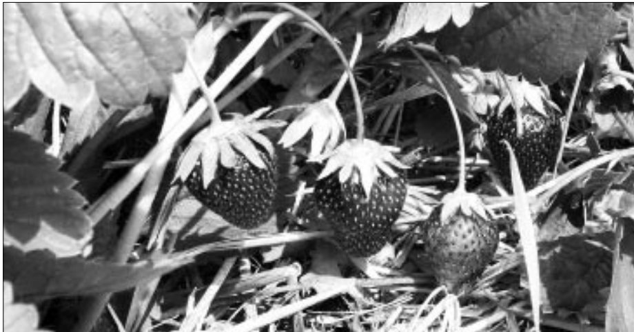
Das Stroh unter den Erdbeeren schützt sie vor Schmutz und damit auch vor Fäulnis.

von Vögeln, Schnecken oder Hasen angefressenen. Wohin damit? Die komplett Verfaulten werden entfernt, den Rest bekommen die Kühe. Eine Kuh war vor ein paar Jahren besonders scharf darauf. Während der Erdbeerernte ist sie immer, wenn man sie abends von der Wiese holte, nach Hause gerannt.