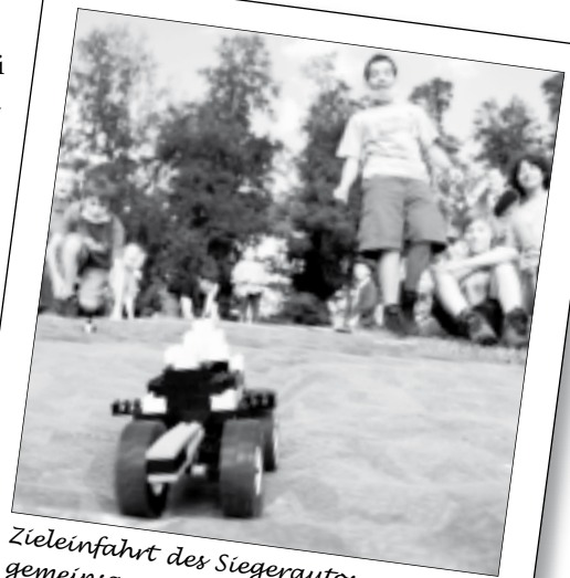
Zieleinfahrt des Siegerautos am gemeinsamen Geländespiel.

Um etwa 20 Uhr gab es Singsong und Pfdadiversprechen am traditionellen Pfadilagerfeuer. Spät am Abend wurden wir müde und gingen ins Bett, Super Mario erzählte den Bienli und Wölfler noch ein